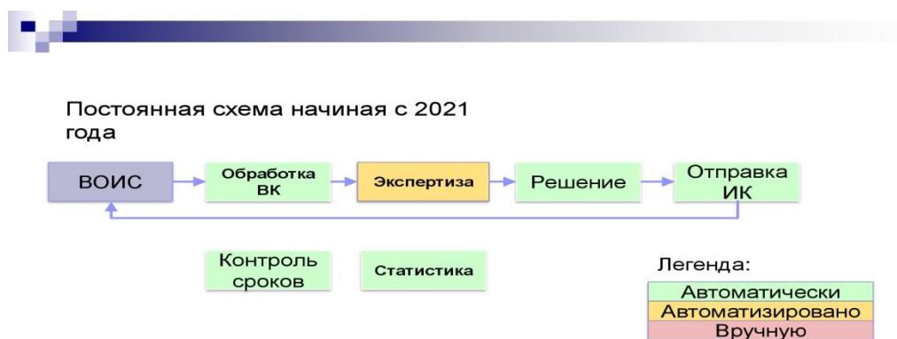
Рисунок 2 – Постоянная схема автоматизации, начиная с 2021 г.

Завершение основных подготовительных работ по приему и рассмотрению международных заявок в соответствии с приказом № 86 запланировано на конец декабря 2017.