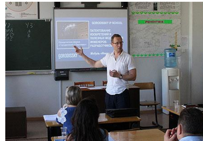
Обучающая Программа «Патентование изобретений и полезных моделей для инженеров-разработчиков» / Август 2017, г. Альметьевск (Татарстан)