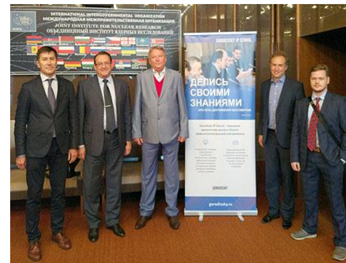
Программа обучения «Управление инновациями» / Сентябрь 2017, г. Дубна